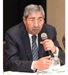
الاخوات والاخوة السادة البرلمانيين الافاضل

وانطلاقاً من واقع القضايا السكانية في الوطن العربي وما يفرضه الواقع من توجهات وبرامج عمل، برزت الحاجة الى تأسيس منتدى خاص بالبرلمانيين العرب معني بقضايا السكان والتنمية، ليكون المظلة الرسمية الدولية للجان البرلمانية المعنية بشؤون السكان والتنمية في المجالس البرلمانية العربية.